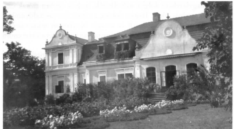
A Lónyay grófok kastélya Tuzséron a századforduló idején